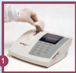
1 Deckel öffnen.