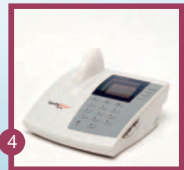
4 Deckel schließen und Ergebnis nach 2-5 Minuten ablesen.

*je nach Test zusätzlich Probeninkubation nötig.