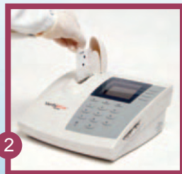
2 Kassette einschieben.