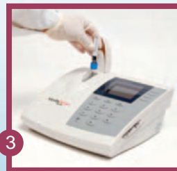
3 Probenröhrchen auf Kassette stecken.