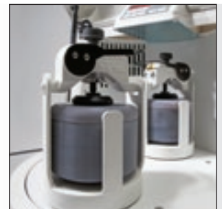
Ebenfalls erhältlich: die P-5 classic line mit 2 Mahlstationen