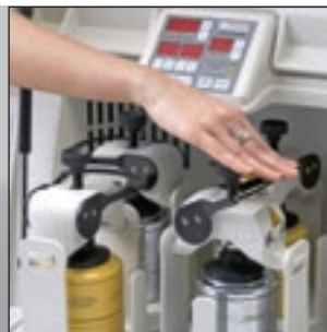
Schnell und sicher: das praktische Safe-Lock-System