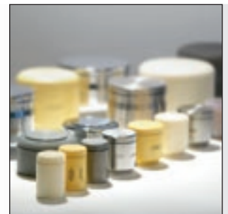
Besonders vielseitig: das FRITSCH Mahlbecher-Programm