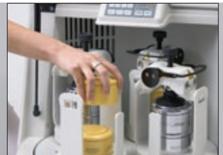
Besonders zeitsparend: gleichzeitige Mahlung von bis zu 8 Proben