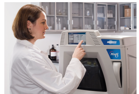
„One Touch“ Start der App mit nur einem Knopfdruck.