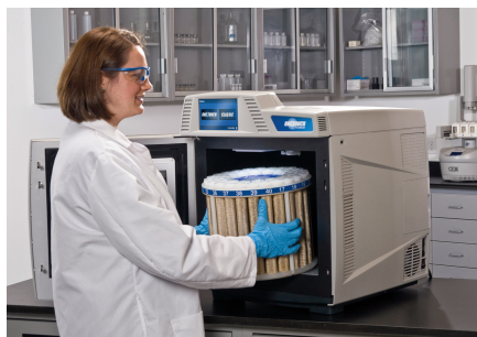
Einsetzen der Aufschlussbehälter ins Mars 6

Einfacher geht es nicht! www.mikrowellen-aufschluss.de