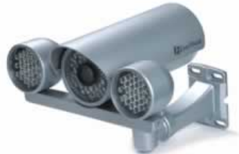
Bild: EZ 650 mit zusätzlichem IR Strahler EIR 100

Spektralbereich: 850 nm Abstrahlwinkel: je 30° (gesamt 30~90° einstellbar inkl. Kamera) Farbe: silber IP Schutzklasse: IP 66 Betriebsspannung: 12 V DC, über EZ 650 Ausgangsspannung Leistungsaufnahme: 17 W max. Umgebungstemperatur: -40°C ~ +50°C Abmessungen (HxBxT): 105 x 130 x 200 mm Gewicht: 750 g Verwendung: mit EZ 650 und EZN 850