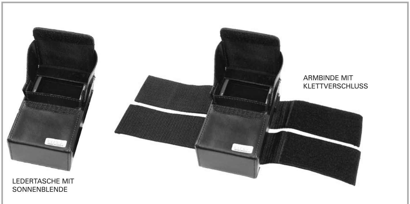
LEDERTASCHE MIT SONNENBLENDE