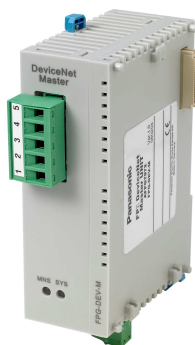
FP-Sigma FMU DeviceNet: FPG-DEV-M für FP2: FP2-DEV-M