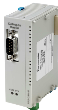
FP-Sigma FMU CANopen: FPG-CAN-M für FP2: FP2-CAN-M