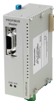
FP-Sigma FMU PROFIBUS: FPG-DPV1-M für FP2: FP2-DPV1-M