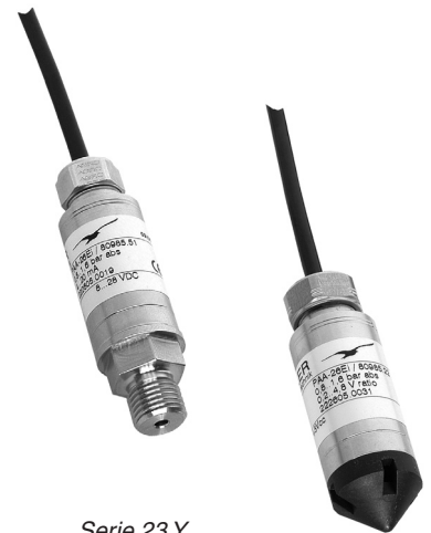
Serie 23 Y