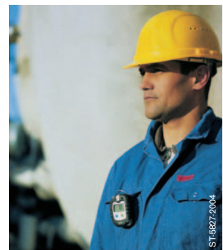
Dräger Pac 7000: Hoher Tragekomfort.