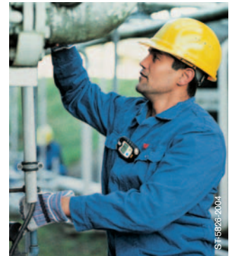
Dräger Pac 7000: Zuverlässig im täglichen Einsatz.

Für weitere Informationen siehe: www.draeger-safety.de/pac