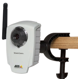
AXIS 207/207W Netzwerk-Kamera mit flexibler Halterung (im Lieferumfang enthalten)