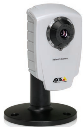
AXIS 207/207W Netzwerk-Kamera mit Standfuß (im Lieferumfang enthalten)