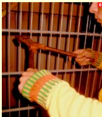
5./6. Sichere Detektion bei Übersteig- und Durchdringungsversuchen