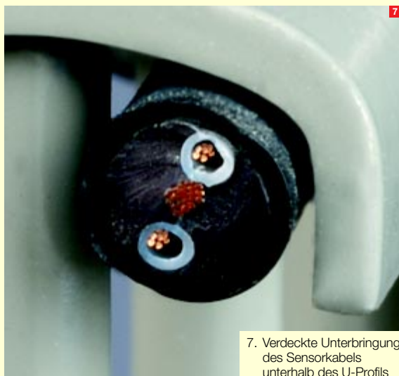
7. Verdeckte Unterbringung des Sensorkabels unterhalb des U-Profils