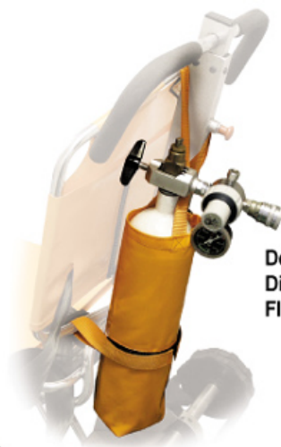
Detailabbildung Die Halterung für die Sauerstoff- Flasche aus verstärktem Nylon