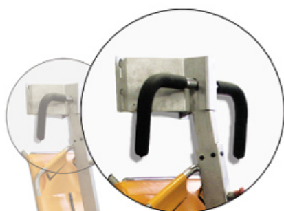
Boden- und Wandhalterung aus Edelstahl für die Montage gemäß BS EN ISO 1789:2000