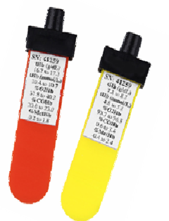
Bequeme optische Qualitätskontrolle