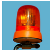
Ext. Alarm- & Schaltausgänge