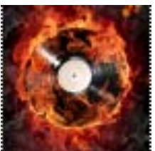
Brand Kohlenmonoxid (CO)