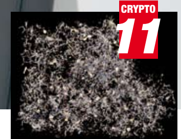
Übertrifft DIN und NSA Standards

Der intimus 005S nutzt die patentierte DATAgrind™-Technologie, um die Datenschicht auf optischen Datenträgern in Partikel von 250 Mikron zu zermahlen. Eine forensische Wiederherstellung ist damit ausgeschlossen.