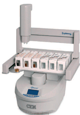
Explorer 72 SP

Die Familie Explorer 48 SP , 72 SP und 96 SP ermöglicht den automatisierten Betrieb sowohl von 10 ml und auch von 35 ml Druckbehältern, was eine Vergrößerung des Ansatzes ermöglicht.