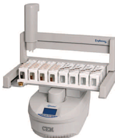
Explorer 96 SP