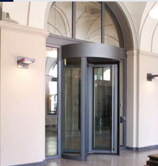
Flexible Integration - Sicherheitskarusselltür in historischer Kulisse