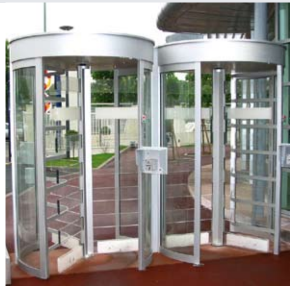
Sicherheitsdrehkreuze, Außenaufstellung - Doppelanlage mit Sperrelementen aus Acrylglas