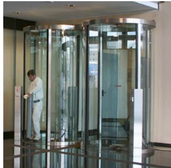
Maximale Transparenz - Doppelanlage in Ganzglasausführung