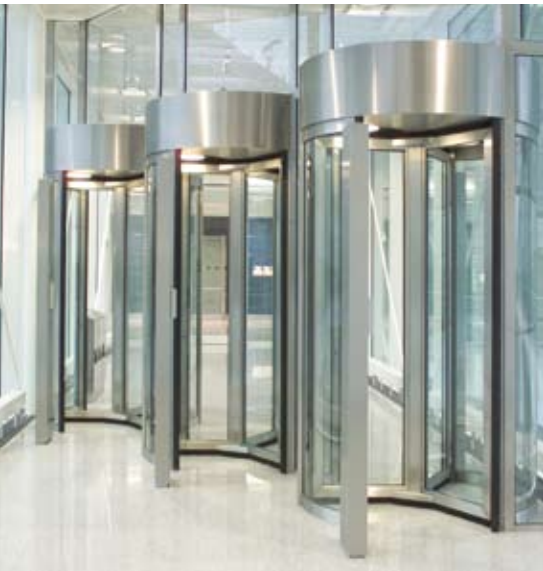
Diagonale Anordnung für schmale Durchgänge - Mehrfachanlage als Personaleingang am Flughafen