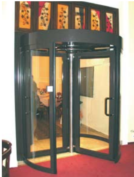
Sicherheitskarusselltür mit geprüfter Fluchtsäule - Türflügel manuell abklappbar