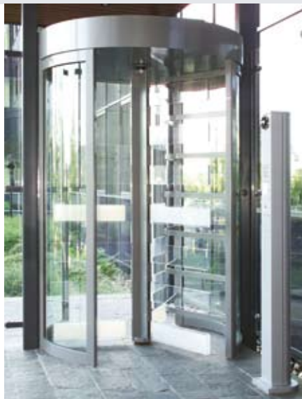
Stilvolle Lösung für Innenaufstellung - Sicherheitsdrehkreuz mit Sperrelementen aus Acrylglas