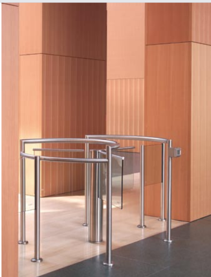
Harmonisch kombiniert: Warmes Holz, Glas und Edelstahl