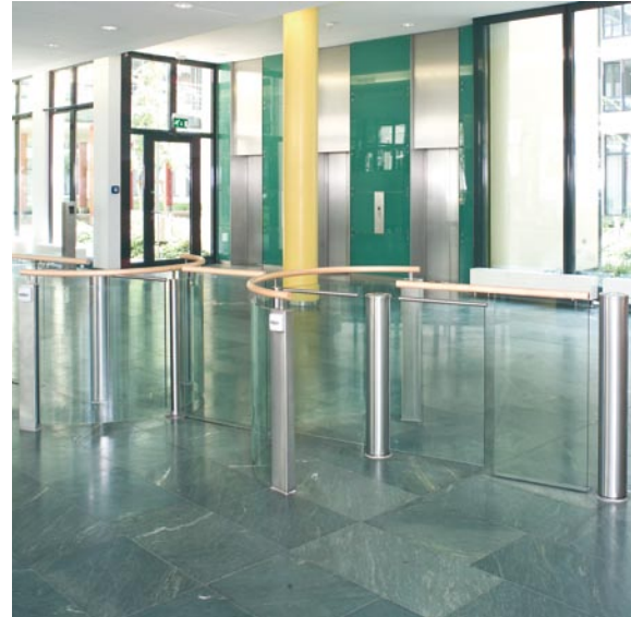
Platz sparende Lösung mit integrierter Schwenktür für Materialtransporte