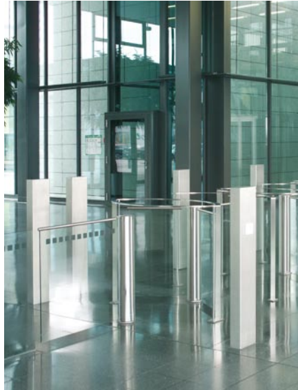
Mit passender Schwenktür als barrierefreie Lösung