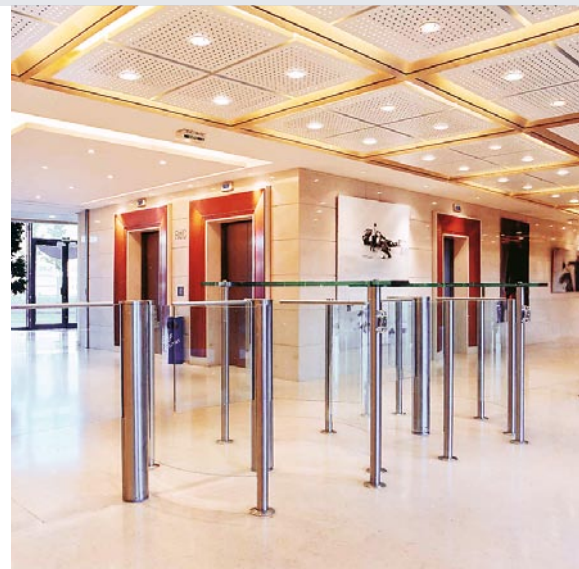
Sonderausführung mit erhöhten Glasflügeln