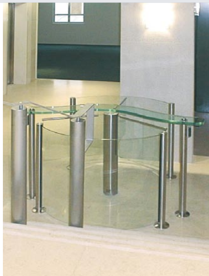
Eine enge Durchgangssituation elegant gelöst mit Charon