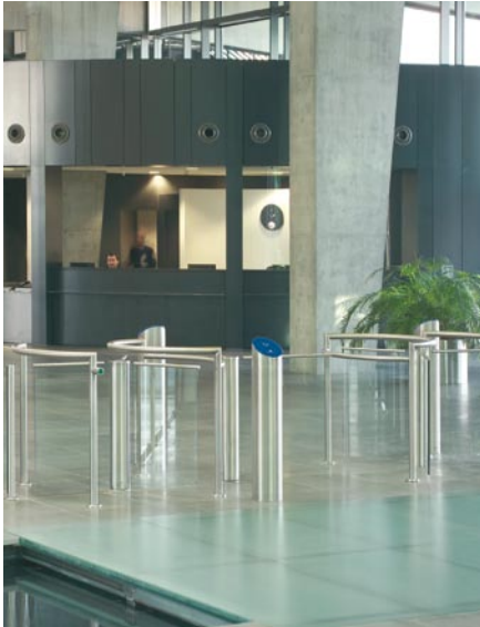
Mehrfachanlage im Foyer - in Sichtweite vom Empfangspersonal