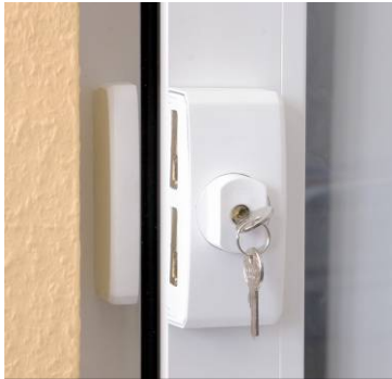
Die FTS 96 E ist beides: Alarmmelder und mechanischer Schutz.

Mit der ersten Funkalarmanlage, die Einbrüche aktiv verhindert, geht die Integration mechanischer und elektrischer Sicherheitstechnik in eine neue Entwicklungsphase. Mit einer innovativen Backlight-Statusanzeige, bidirektionalen Bedienelementen, 48 Funkzonen und dem aktiven Schutz vor Einbruch setzt die Secvest 2WAY von ABUS Security-Center völlig neue Funktions- und Designmaßstäbe im Sicherheitsmarkt.