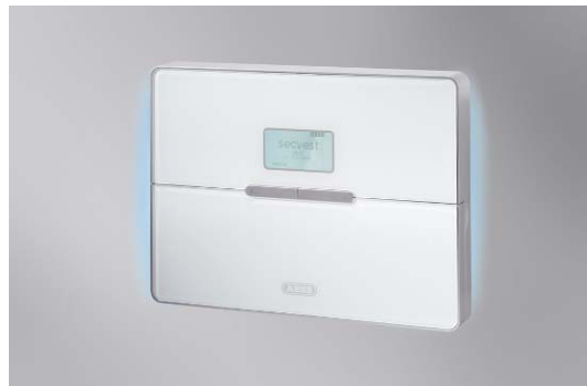
Noch bevor der Eindringling die mechanische Sicherung überwunden hat, weiß die Secvest 2WAY Bescheid und alarmiert.