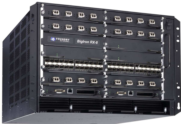
Bild 5: Das Klinikum der Johannes Gutenberg-Universität Mainz vertraut auf die hochmodernen BigIron RX-8 Switches von Foundry Networks. Der BigIron RX-8 bietet einen Durchsatz von 571.000.000 Paketen pro Sekunde und eine Switching-Kapazität von bis zu 1.92 Tbit/s.