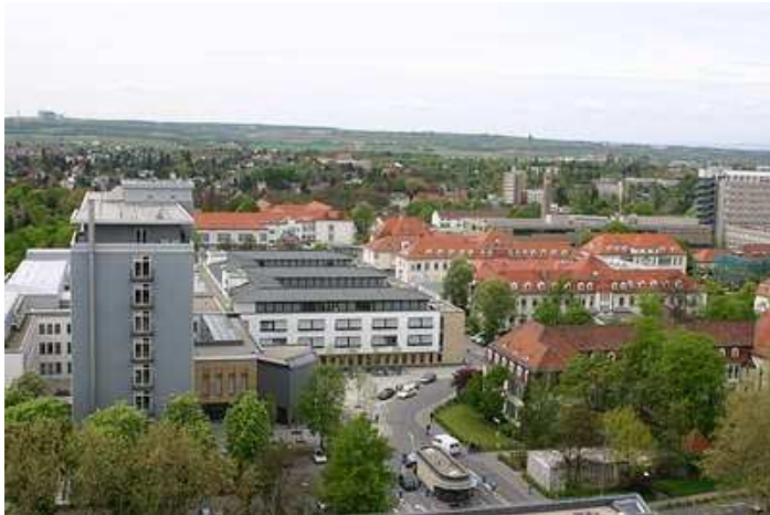
Bild 1: Das Netzwerk des Klinikums der Johannes Gutenberg-Universität Mainz verbindet auf 24 ha mit 177.000 qm Nutzfläche etwa 60 Bereiche, wie Kliniken, Verwaltung, diverse Schulen, etc.